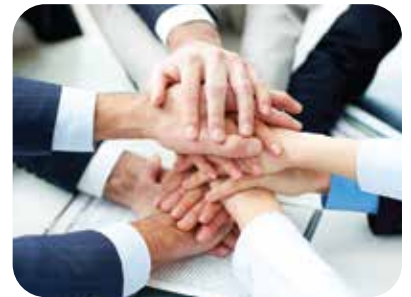
Matriz - São Paulo